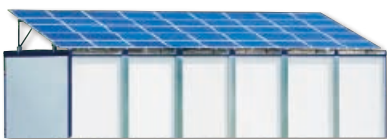
スーパーアグリプラント外観

そんな中、コンテナ植物工場「スーパーアグリプラント」は、太陽光発電設備の搭載や、高气密・高断熱のコンテナ設計で創エネと省エネを同時に実現し、ランニングコストを削減しながら温度・湿度、養液・CO 2 濃度、光量・光質などの環境制御技術で美味しい野菜を作り出している。また、販売を行う日栄インテックグループがスーパーアグリプラント導入事業者に対しては美味しい野菜を作って売るためのノウハウも提供する。ハードとソフト両面においてきめ細やかな対応がされるため、少量多品種栽培が求められる今日の植物工場では魅力的な商品と言える。