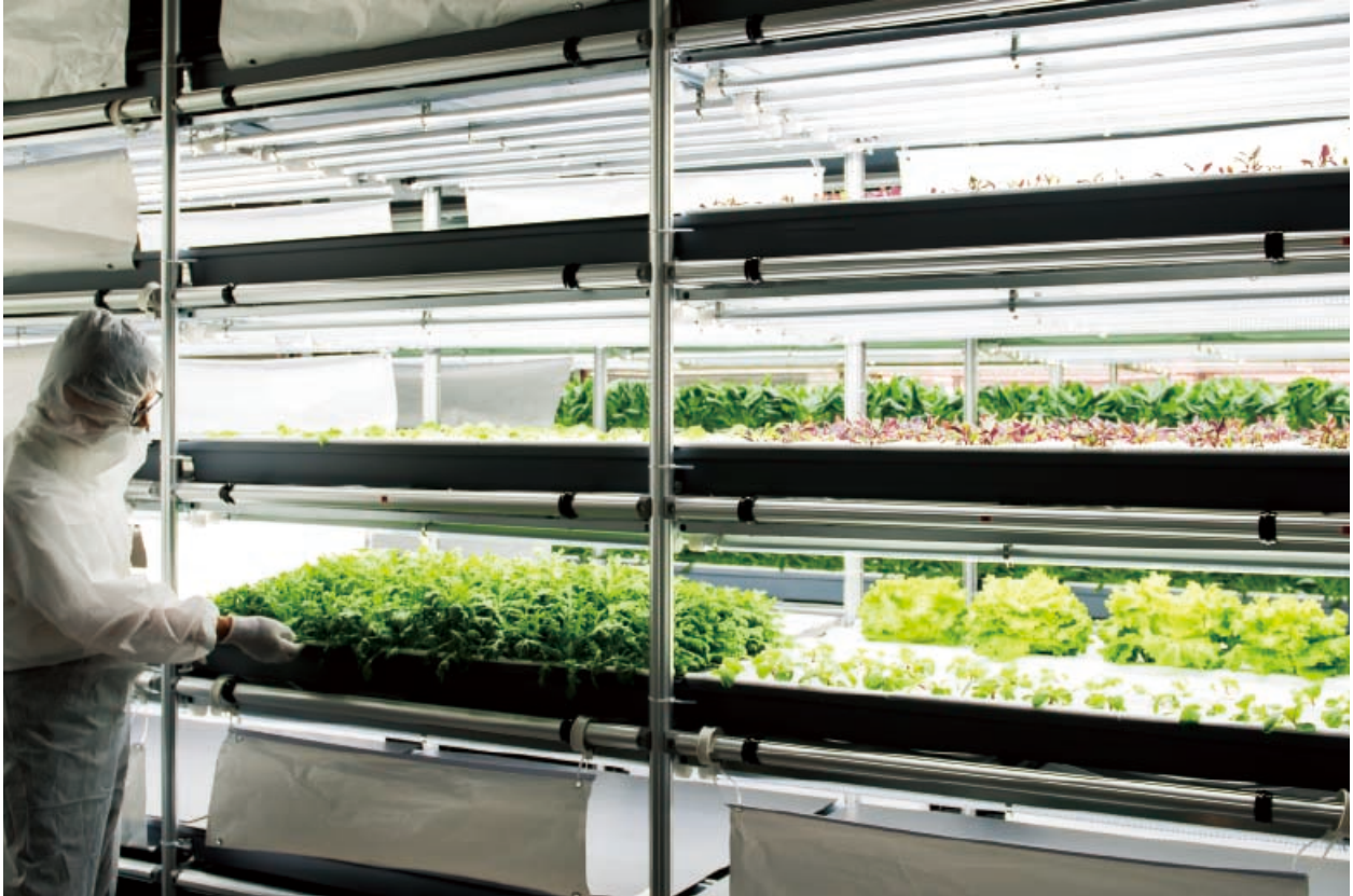
実証プラント内部の様子。天井高は3mあり、ゆったり。日本で一般的な2.4mタイプに比べ、限られたスペースでも無理なく栽培数を増やすことができる。