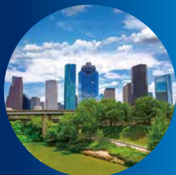
国内クレジット/J-クレジット によるオフセット