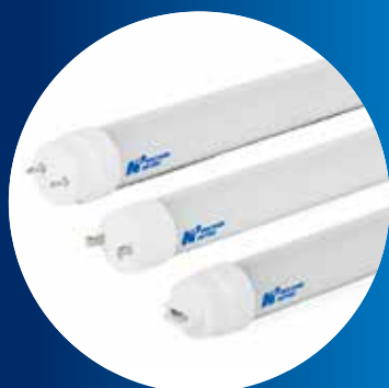
直管型LED蛍光灯 Mシリーズは全て認証済